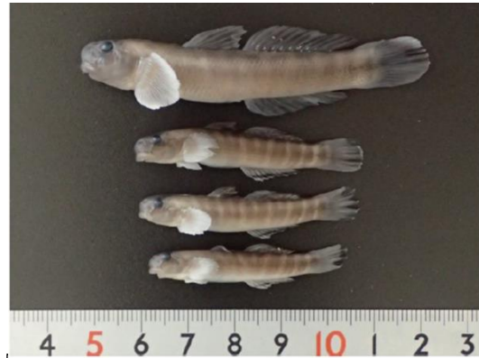
図5 ボウズハゼ 2019年10月1日 津谷川 旗(2020)から転載