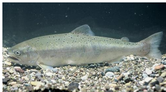
図4 河川に遡上したサクラマス

①サクラマス：北海道と本州における捕獲数は変動しているが、1990年代以降、増加傾向にある。北海道と本州各県がサクラマス幼魚の放流を継続しており、これにより資源が維持されている可能性がある。一方、サクラマスは産卵親魚が春に川へ遡上し、夏季に淵などに滞留し（図4）、秋に産卵するので、温暖化に伴う水温上昇や渇水により死亡リスクが高まる可能性がある。