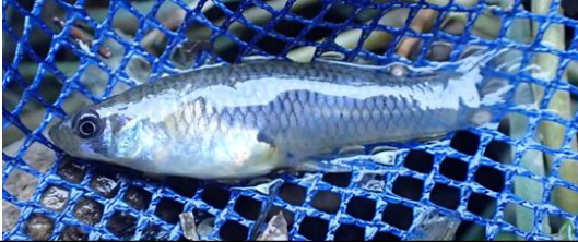
図6 カダヤシ 2018年8月 金沢市