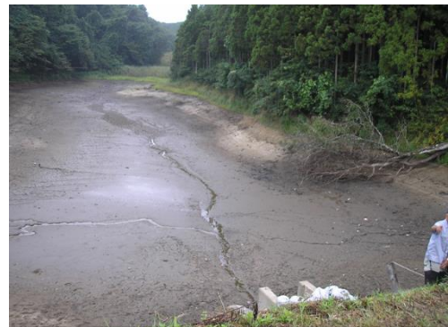
図7 堰堤の損傷で干出したため池

2100年には40～80cmの水位上昇が予測されている。河口周辺の汽水域で産卵するイトヨ、シロウオ、ウツセミカジカやウキゴリ類などの産卵場が減少する可能性がある。